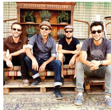
© Mister Leu and the Nyabinghers

Les Collections de Saint-Cyprien, village