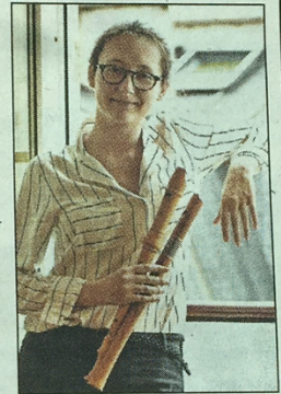
concert de flute «flauto solo»

8ème CHALLENGE DE PÊCHE À LA TRUITE Christophe VANKEMMEL, organisé toute la journée au lac par l'association des Pêcheurs du Riberal. Les réservations au concours et au repas étant limitées, il est recommandé de s'inscrire avant le 13 août en téléphonant à un des numéros suivants : 07 69 47 41 25, 06.87.13.01.83 ou 04 82 44 99 37 (20 euros pour 8 prises, permis de pêche obligatoire).