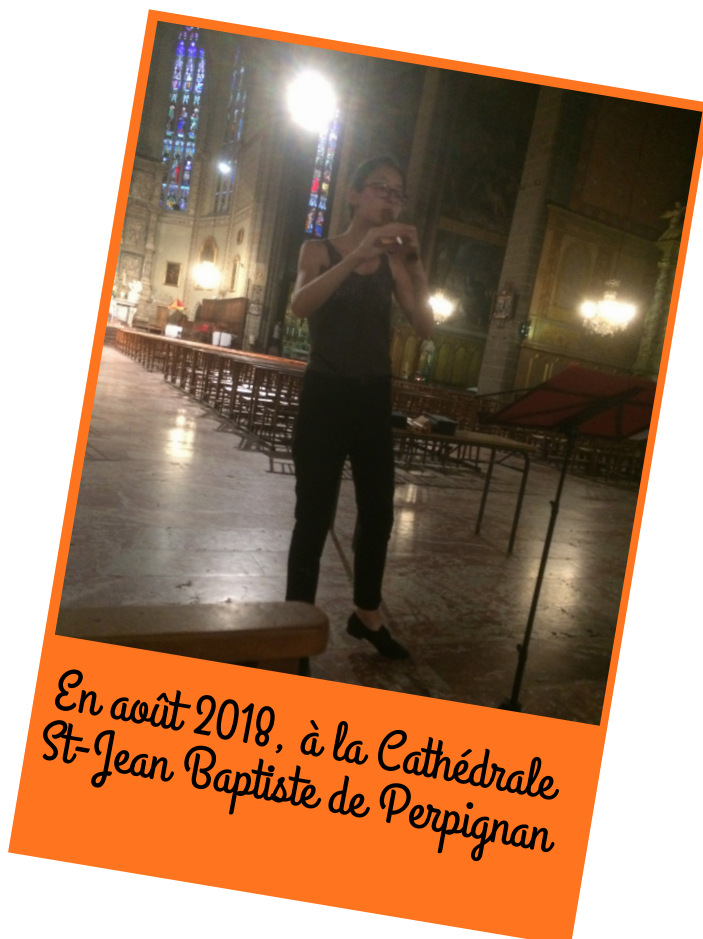
En août 2018, à la Cathédrale St-Jean Baptiste de Perpignan

Chaque concert est un moment de partage avec le public pour découvrir les flûtes douces mais aussi tout le répertoire de ces instruments dits anciens. De la musique baroque à la musique renaissance en passant par la musique médiévale, ce récital est un voyage en musique à travers les siècles.