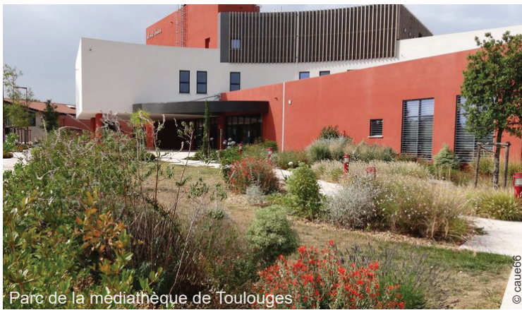
Parc de la médiathèque de Toulouges