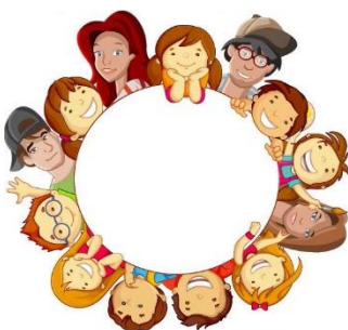
Table ronde parents et enfants

Les enfants (à partir de 8 ans) décoreront leur propre boîte et réaliseront un mini-livre à secrets. En s'inspirant des bestiaires et des sculptures de l'artiste Jephon de Villiers, ils créeront également une créature végétale, « gardienne de la boîte ».